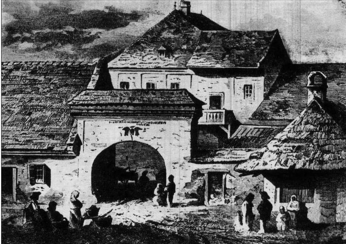
Palatul Princiar din Turda

Habitatul orașului medieval cunoaște o dezvoltare și sub aspectul aprovizionării cu apă potabilă. Tot mai mulți călători străini, vorbesc în scrierile lor de casele frumoase, de grădinile cu flori și pomi fructiferi, dar și de viață de zi cu zi a locuitorilor.